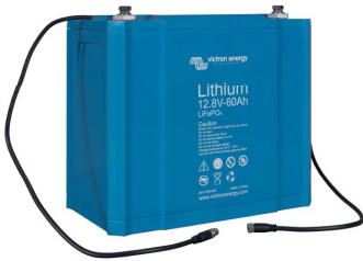
Batterie LiFePO4 12,8 V 60 Ah