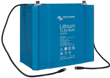
Batterie LiFePO4 12,8 V 90 Ah

Notre BMS de 12 V pourra prendre en charge jusqu'à 10 batteries raccordées en parallèle (les BTV se connectent facilement en série).